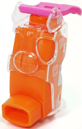
吸入トレーナー (フルプッシュ®*装着時) *噴霧補助具